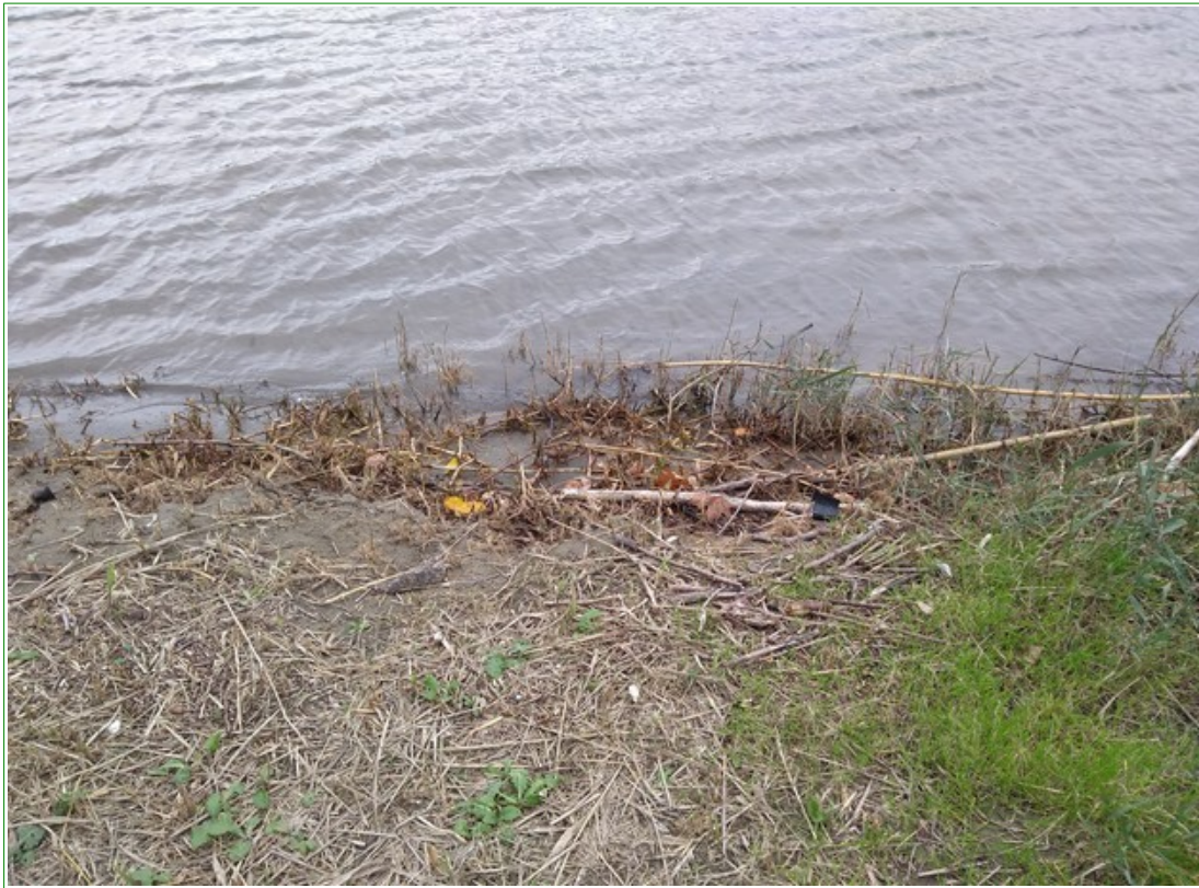
Foto 3 - area sponda ex Telara: vegetazione erbacea lungo la riva