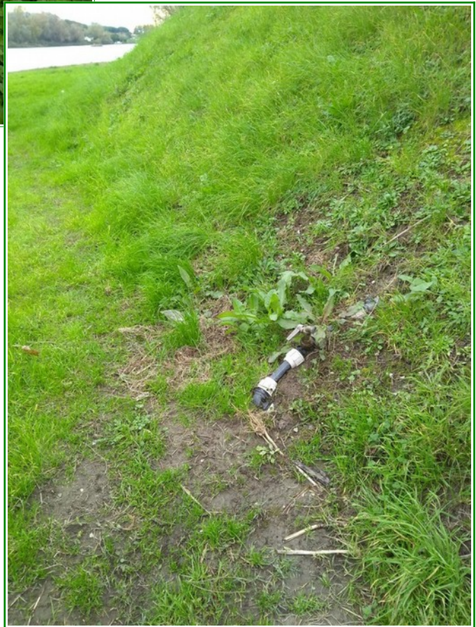
Foto 1-2 area sponda ex Telara: vegetazione erbacea lungo la riva