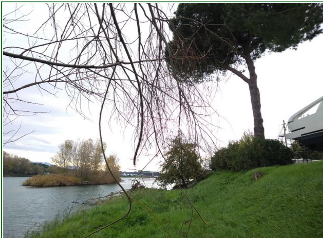
Foto 4 - area sponda ex Telara: parte terminale con evidente il ciglione con pino domestico e oleandro