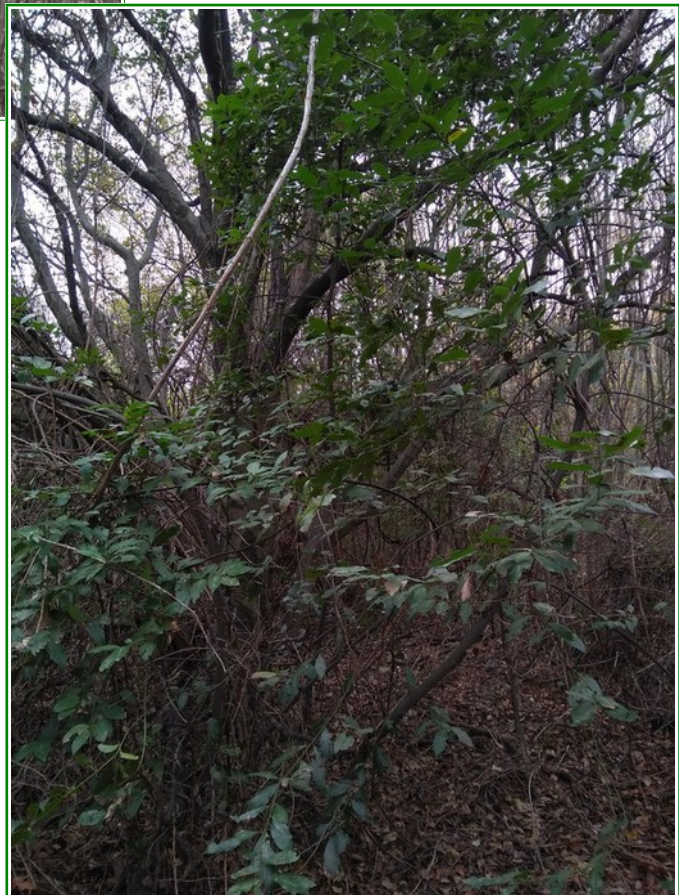
Foto 7-8 - area ex Telara: danni da clematide e intrico di vegetazione